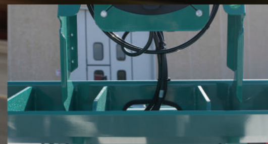
PIASTRA RALLA RINFORZATA