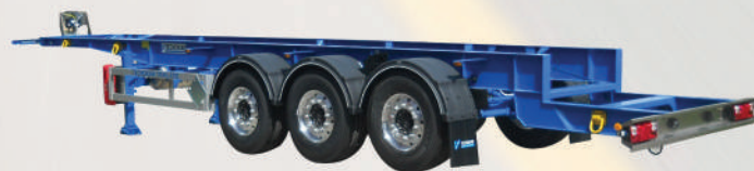
TESTATA POSTERIORE A SBALZO VERNICIATA