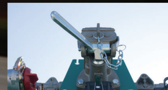
GIUNTA ARIA CUNA