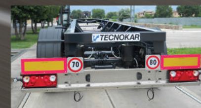
INOX SENZA BAVETTA