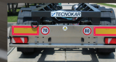
INOX CON BAVETTA