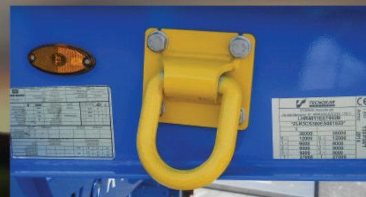
ANELLO ANCORAGGIO NAVE