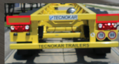
CON BARRA QUADRA IN ACCIAIO