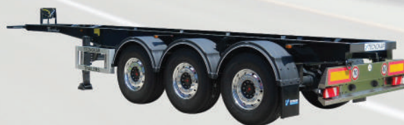
TESTATA POSTERIORE DRITTA