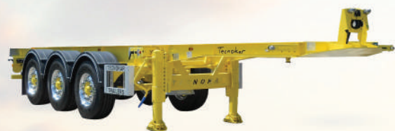
TELAIO IN ACCIAIO VERNICIATO