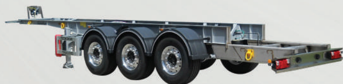
TESTATA POSTERIORE A SBALZO INOX