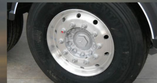
CERCHI IN LEGA